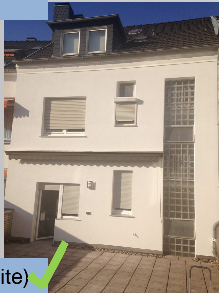
Neustraße 3 (Rückseite) ✓