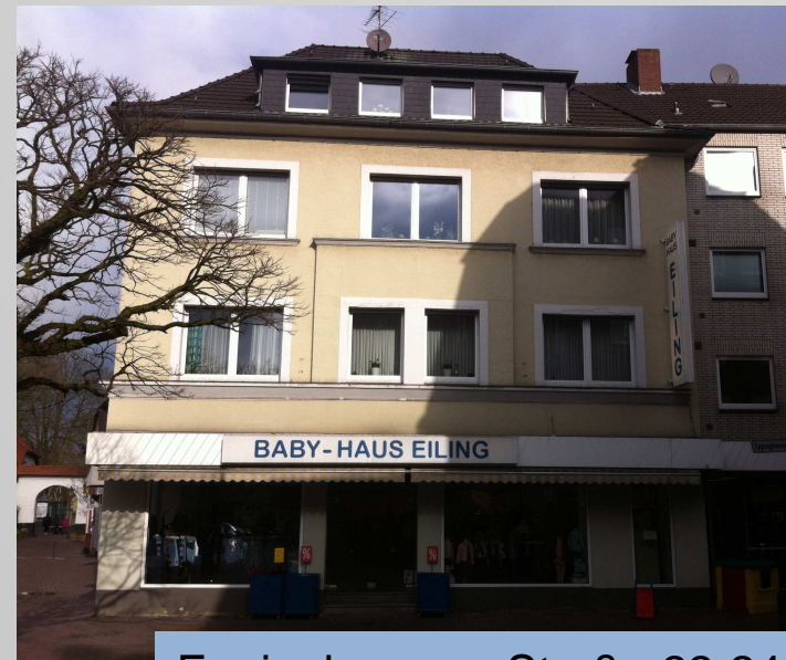
Eppinghovener Straße 22-24